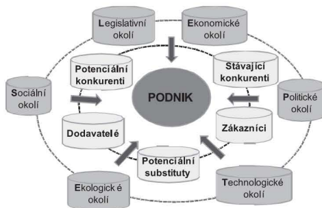
Obr. 2: Informační zdroje pro CI